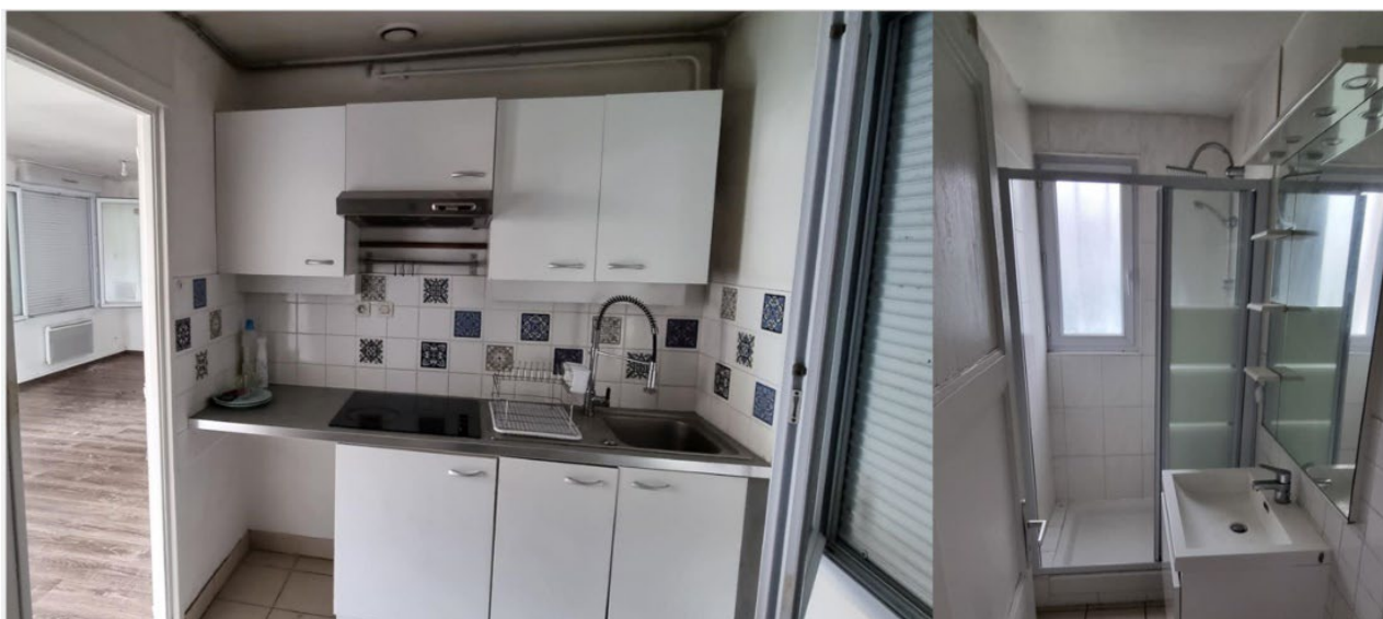
Cuisine aménagée partiellement