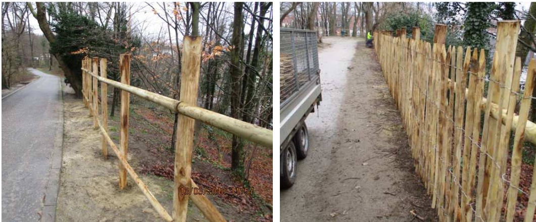
Clôture robuste de plus haute taille avec des lisses

On peut rehausser l'entièreté de la clôture de 10cm pour laisser un passage sur toute sa longueur