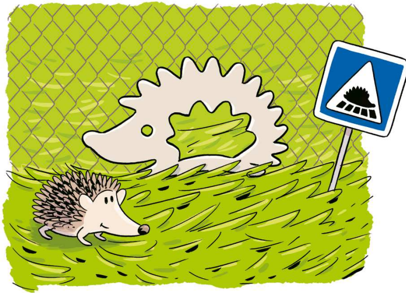
Passage pour petite faune (lapins, hérissons, écureuils)