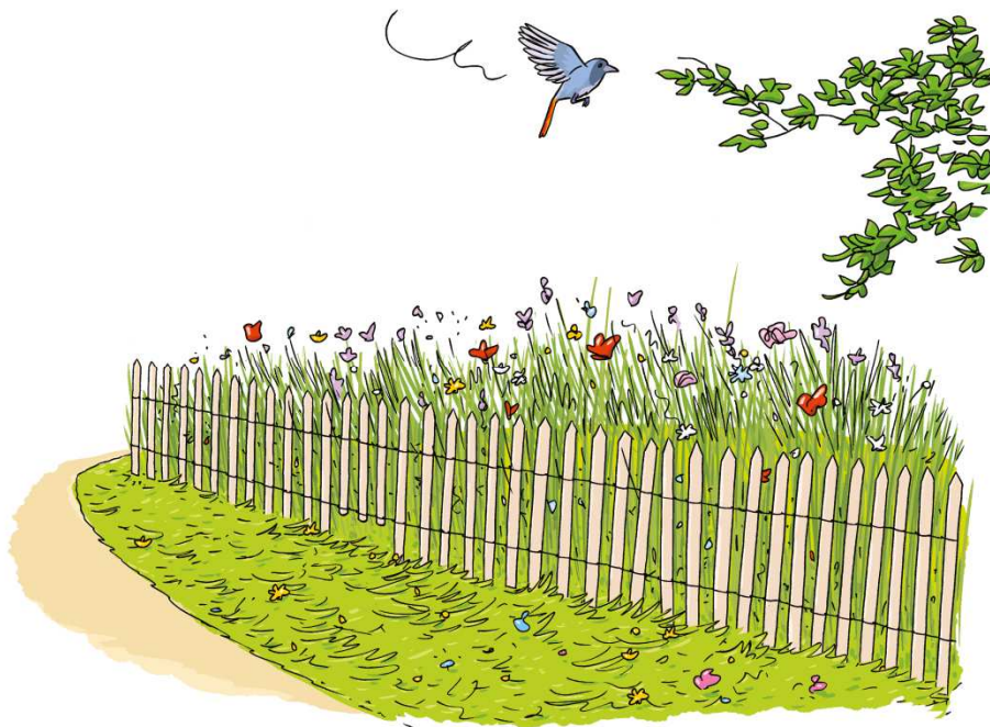
Clôture en châtaignier aménagée par Bruxelles Environnement avec une ouverture (lattes raccourcies en bas)